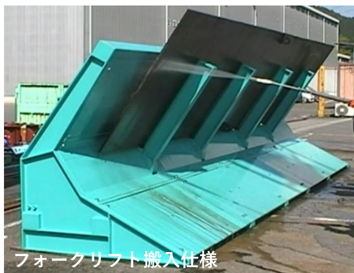
フォークリフト搬入仕様