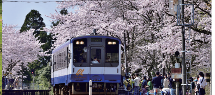
能登さくら駅（穴水町）