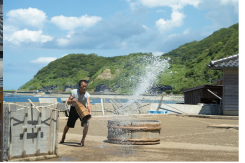
掬が浜塩田（珠洲市）