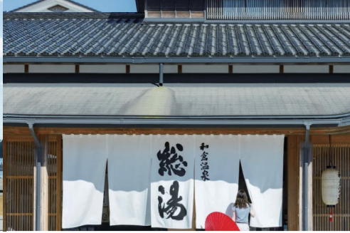
和倉温泉総湯（七尾市）