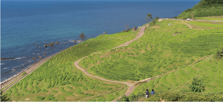
白米千枚田（輪島市）